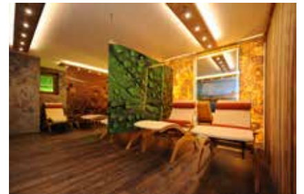
Gestaltung eines Wellnessbereichs, Hotel Unterellmau, Hinterglemm